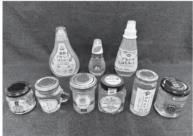
(上段左から：No.1～3、下段左から：No.4～9)

糖は3.4gでした。麦芽糖は検出されませんでした。アカシアはちみつは、一般的に果糖の割合が高いはちみつとされますが、今回のテストでも、全銘柄で果糖が含まれている量が多いことが示されました。果糖の割合が多いはちみつは、常温で固まりにくい性質を持っています。