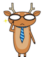
消費者教育PRキャラクター 「かしこしか」