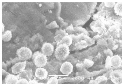
米に付着したカビの孢子（4000倍）

走査電子顕微鏡で観察したところ、黒いのはカビでした。洗米して白くなったとしても、食用としては好ましくないことを伝えました。また、保存場所の温度と湿度が高いとカビが生えやすいので、保管方法に注意するよう助言しました。