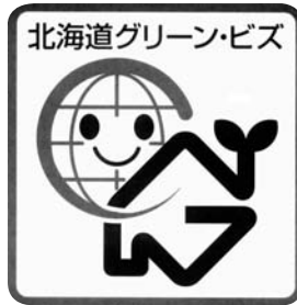
北海道グリーン・Biz制度のマーク

申請は、道のホームページからでも可能です。問い合わせは、札幌市外の事業所は道庁☎011・231・4111(内241218)、札幌市内の事業所は札幌市役所☎011・211・2879へ