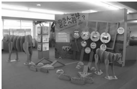
エコゾーンは模型などが段ボール製。子どもの環境学教育に役立ちそう

今後の活動としてまず実態を把握するため、市民、自治体、事業者に対して7月上旬にアンケート調査を実施する予定です。