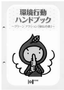
「環境行動ハンドブック」

同部門は、道が挙げた15の環境に優しい取り組み項目のうち、1つでもクリアしていれば登録できます。札幌市外の事業所は同制度に申し込み、札幌市内の事業所は、札幌市が実施する「さっぽろエコメンバー登録制度」に申し込みます。「さっぽろ