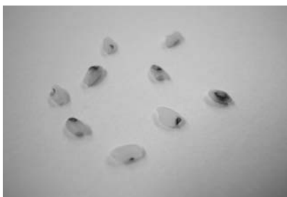
着色粒（白米の一部が黒い）

米の等級により、着色粒の含有率の上限が設定されています。1等米で0.1%以下、2等米で0.3%以下、3等米で0.7%以下です。なお、表示基準の中では、「等級」表示は必要ありません。