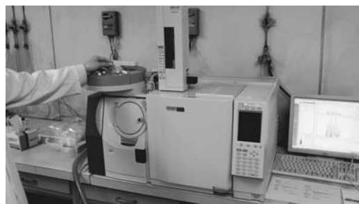
農薬を検出する機器（ガスクロマトグラフ質量分析計）

主な農薬89種類および重金属（鉛・カドミウム）は、すべて検出されませんでした。（表1参照）