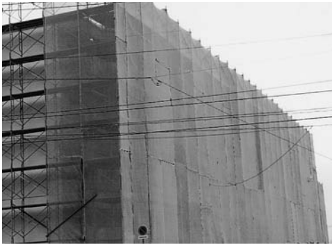
大規模修繕に備えて適切な修繕積立が必要に