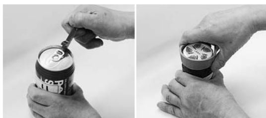
No. 9 キーリングプルタブオープナー No.10 キャップオープン

ました。表示の使用用途に「ジャム瓶の蓋」もありましたが、ねじ蓋のジャム瓶は開けられません。