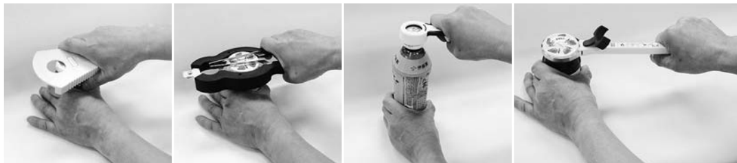
No. 1 らくらくオープナー No. 2 瓶蓋開け