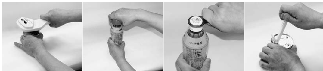
No. 5 楽々びんオープナー No. 6 ペットボトルオープナー No. 7 チアパック・ペットボトルオープナー No. 8 プルタブオープナー