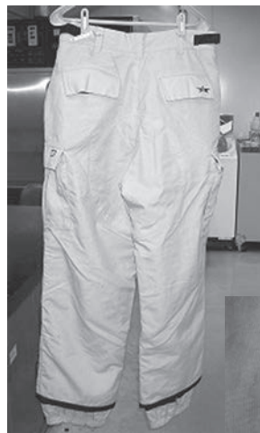
色むらが発生した 拡大画像

Q. 5年ほど前に購入したスノーボードウエアのズボンをクリーニングに出したところ、まだらな変色が発生しました。