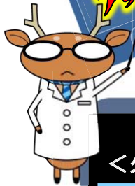
北海道消費者教育 PR キャラクター 「かしこしか」

「LINE 乗っ取り詐欺」は、携帯電話用の無料通話アプリ「LINE」であなたの友人になりすまして、「携帯番号を教えてほしい」とメッセージを送ってきます。携帯番号を教えると、次は4桁の認証番号を要求してきます。犯人は、「入手した携帯番号と4桁の認証番号」を基に新しいアカウントを作り、今後はあなたになりすまします。詐欺に利用される可能性が高いため注意が必要です。