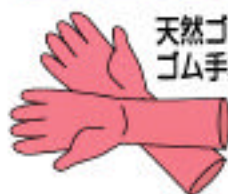
天然ゴム使用の ゴム手袋