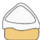
台所まわりの 水切り用品