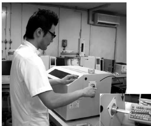
水銀測定装置で素早くチェック。右の拡大部分は検体を入れる試料室