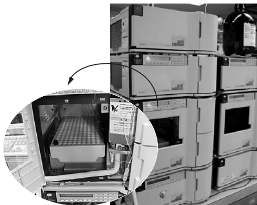
食品添加物などの有無を調べる分析機器。 左の拡大部分は検体を入れる試料室

最近では消費者から魚のすり身にソルビン酸（保存料）の表示があるので有無を調べてほしいという依頼がありました。また、イチゴジャムや黒酢の糖の組成をテストしました。