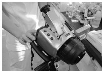
赤外線カメラで温度チェック