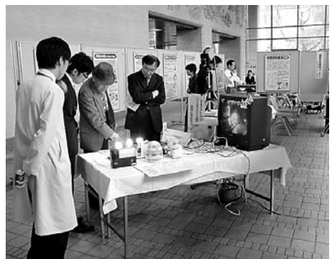
昨年のロビー展。熱心にLED電球に見入る来場者

道と（社）北海道消費者協会は、5月の消費者月間にちなみ、19、20の両日、札幌市中央区北3西6の道庁ロビーでパネル展を開催します。くらしの安全、安心をテーマとしたパネル展示や商品テストの結果などを紹介するとともに、相談コーナーも設けます。契約などで困りごとがありましたら、お立ち寄りください。