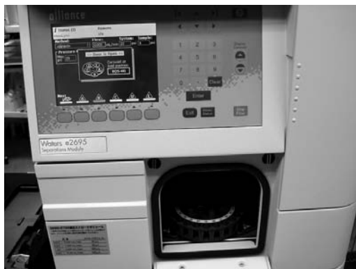
残留農薬も分かる最新型の分析機器

最近では輸入エビなどに使用されている抗菌剤をテストしました。今後はペットフードの残留農薬などもテストする予定です。