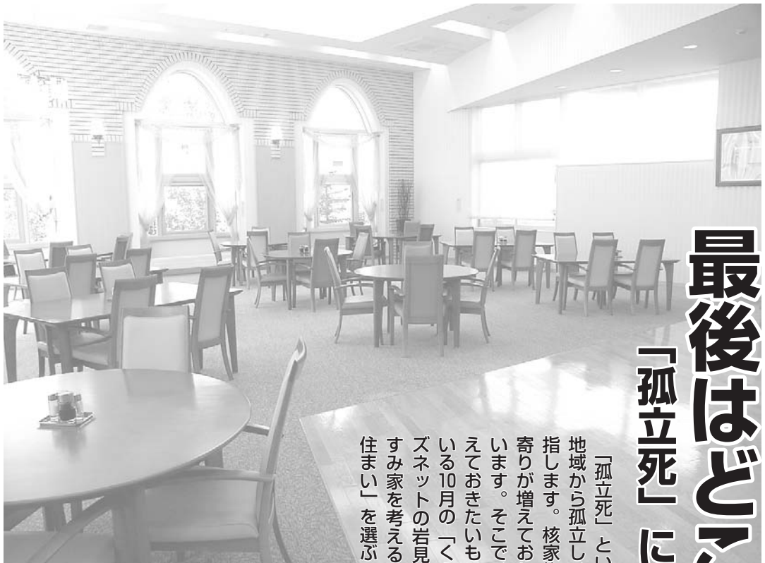
住まい選びは慎重に（札幌市内の老人ホームの食堂）