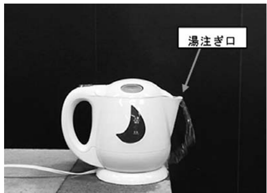
湯が吹き出す様子（定格容量より水を多く入れた場合）