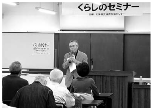
毎回、人気を集める岩見代表の講座

家族とのつながりが希薄なので一人暮らしは不安。特別養護老人ホームなどの施設に入り、福祉のお世話になるうーと考えるようですが、そう簡単に施設へは入れません。道内の待機者は実に約2万3000人。待つていれば入居できるわけではなく、ニーズの高い人順、つまり病气などの症状の重い人順なのです。